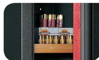
Particular of shelf of mod. HS/400S

* Excluding the high of the shelf (HS/400S) or the security box (HS/400SC - HS/600SC).